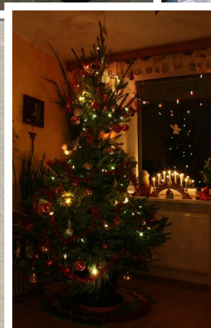
Fotografie zaslané výherci soutěže Rozsvítíme Vaše Vánoce.